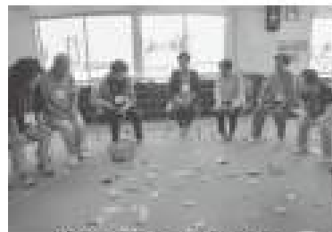
元町サロンコスモス 魚釣りゲーム