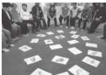
緑町サロンそよかせ 英蘭かるた