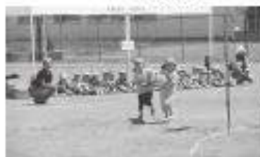
ジャンボバトンリレー