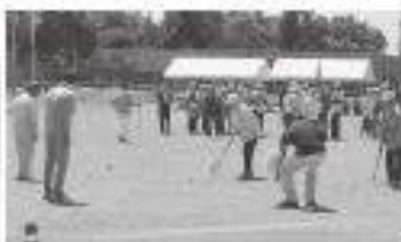
ゲートインリレー