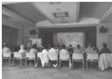
東町サロンたんぽぽ 剣淵の四季スライドショー