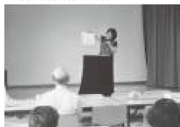
西町サロンなごみ 読み聞かせ

サロンに参加いただくことで安否確認することができます地域の中で見守りのネットワークが形成されます。