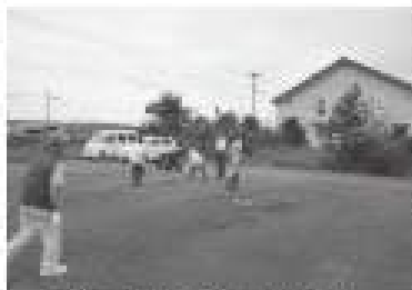
屯田町サロンとんでん バタンク大会