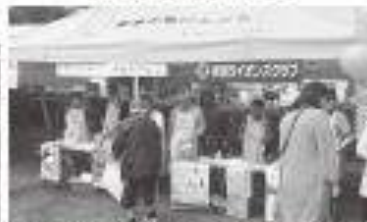
人権擁護活動・保護司会活動