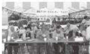
屋外デイサービスセンターりんどう