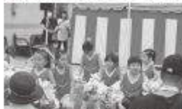
絵本の空けんがらジュニアチャリーディング