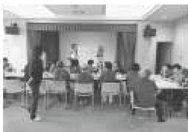
仲町サロンひまわり 参加者全員で合唱