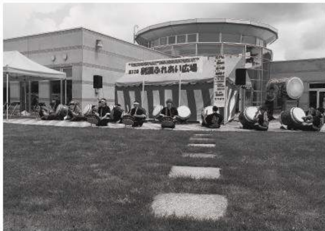
剣淵屯田太鼓・子龍太鼓

〒098-0338 上川郡剣淵町仲町28番1号 ふれあい健康センター内 Tel0165-34-3922