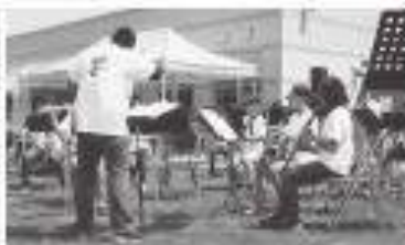
剣淵中学校吹奏楽部