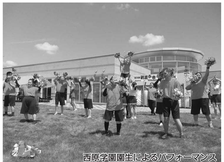
西原学園園生によるパフォーマンス

初の取り組み国際交流教室!! タウタイモリル(モンゴル語) セラマトダタン(インドネシア語) ようこそって意味です。難しい