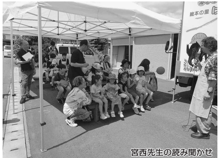
宮西先生の読み聞かせ